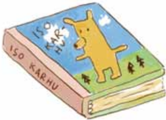
bild för sig själv. Älskande och omhändertagande vuxna stöder bäst barnets utveckling genom att uppmuntra barnet till konstnärlig aktivitet och också själva ta del av den tillsammans med barnet. Att till exempel musicera tillsammans eller att sätta upp en gemensam teaterproduktion ger en lärare inom småbarnspedagogik en enastående möjlighet att begripa barnets sätt att tänka.

Med hjälp av konstfostran skapas respekt mellan olika generationer samtidigt som man genom den skapar sig en väg mot framtiden. Konstens många kommunikationsformer främjar effektivt förståelse och kommunikation mellan människor. Att delta i förberedelserna för en gemensam fest är för ett barn en viktig del av samhörighetskänslan. Genom att delta och genom gemensamma konstnärliga erfarenheter knyter barnet an till sin kultur. Den här kulturella identifikationsprocessen hjälper barnet att på en bredare front finna sin identitet och forma den. Barn har en otrolig förmåga att förvåna sig och skapa nya idéer och dessa måste få utrymme, för varje generation ger upphov till något nytt vid sidan av den traditionella konstkulturen, ett frö av uppmuntran till att tänka kreativt sås redan i den tidiga barndomen.